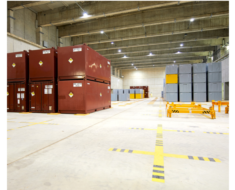
Blick in den Lagerbereich für schwach- und mittelradioaktive Abfälle

stützen dabei mit entsprechendem Fachpersonal. Die Stadt Ahaus entscheidet im Einzelfall je nach Lagebeurteilung über eine Warnung der Bevölkerung und über die Unterrichtung und Veranlassung von Schutzmaßnahmen. Bei einer festgestellten Großeinsatzlage oder Katastrophe geht die Zuständigkeit auf den Kreis Borken über.