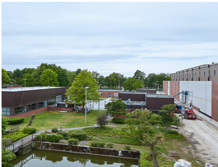
In den vergangenen Jahren wurde eine zusätzliche Schutzwand rund um das Lagergebäude gebaut.

gerhalle gebaut. Außerdem wurden Abläufe installiert, die das Kerosin im Falle des Absturzes eines Flugzeuges nach außen ableiten und somit die Dauer eines Brandes in der Lagerhalle minimieren. Die für das Zwischenlager Ahaus zuständige Genehmigungsbehörde, das Bundesamt für die Sicherheit der nuklearen Entsorgung (BASE), stellt fest, „dass durch einen gezielt herbeigeführten Flugzeugab-