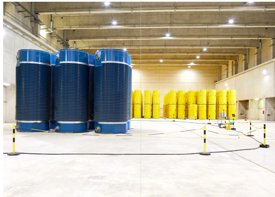
Blick in den Lagerbereich für hochradioaktive Abfälle

Für den Transport und die Zwischenlagerung von ausgedienten Brennelementen und Abfällen aus der Wiederaufarbeitung werden Behälter vom Typ CASTOR eingesetzt. Weltweit sind bereits über 1.500 CASTOR-Behälter beladen und eingelagert. Das technische Prinzip der Transport- und Lagerbehälter hat sich über Jahrzehnte bewährt: Die vom radioaktiven Inventar ausgehende Strahlung wird durch den Behälter sicher abgeschirmt. Die Behälter sind mit zwei Deckeln verschlossen. Dieses Doppeldeckelsystem garantiert den sicheren Einschluss des radioaktiven Inventars.