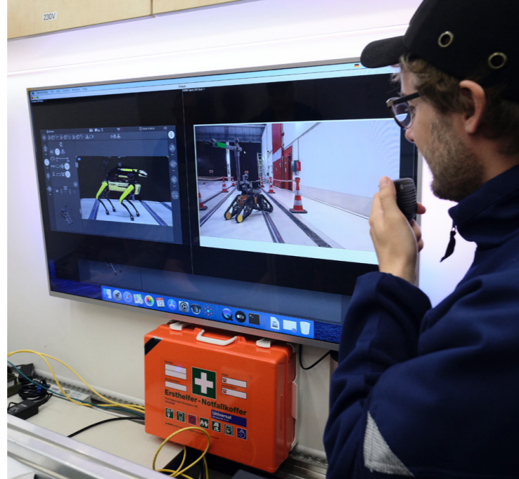
Übung zur Notfallvorsorge am Zwischenlager von BGZ und KHG (Kerntechnische Hilfsdienst GmbH)

zur Verringerung der Störfallfolgen getroffen werden.