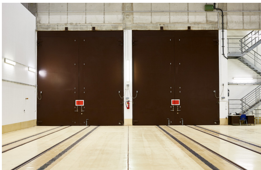
Zugang zur betriebseigenen Gleisanlage