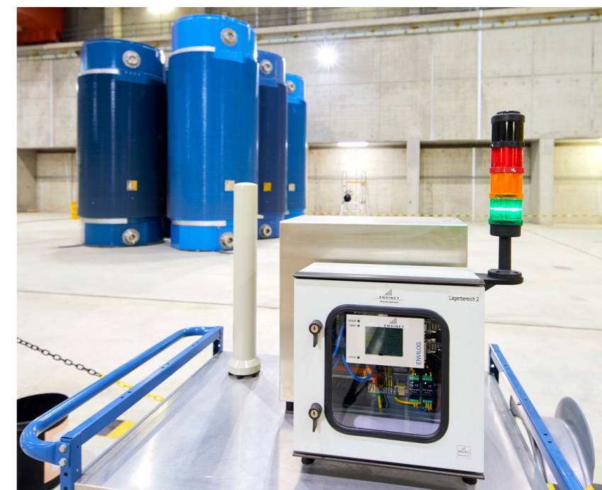
Eine der Strahlungsmesseinrichtungen innerhalb der Lagerhalle

Anlagensicherungszaun rund um das Zwischenlager kontinuierlich die aktuellen Strahlungswerte. Die von der BGZ und deren Aufsichtsbehörde gemessene Strahlung - Ortsdosisleistung genannt - liegt am Anlagenzaun seit Beginn der Einlagerungen von radioaktiven Abfällen im Zwischenlager im Schwankungsbereich der natürlichen Strahlung und somit weit unter den gesetzlichen Grenzwerten.